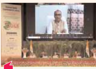
सरकार ऐसी पहलों का समर्थन करने के लिए प्रतिबद्ध है जो दीर्घ कालिक हों और कृषि के लिए लाभदायक हों : शिवराज सिंह चौहान

केंद्रीय मंत्री ने उपस्थित लोगों को बताया कि प्रदूषण, धरती में आवश्यक नाइट्रोजन और फॉस्फोरस के अभाव के कारण मिट्टी की उर्वरता कम हो रही है। इससे न केवल उत्पादन पर असर होगा बल्कि आने वाले समय में किसानों की