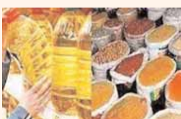
दाल, उड़द दाल और अरहर दाल के भाव में कोई बदलाव नहीं हुआ।

गुड़-चीनी : मोटे के बाजार में स्थिरता रही। इस दौरान चीनी और गुड़ के भाव पिछले कारोबारी दिवस के स्तर पर टिके रहे। दाल-दलहन : दाल-दलहन के बाजार में उड़द दाल को छोड़कर टिकाव रहा। इस दौरान चना, दाल चना, मसूर दाल, मूंग