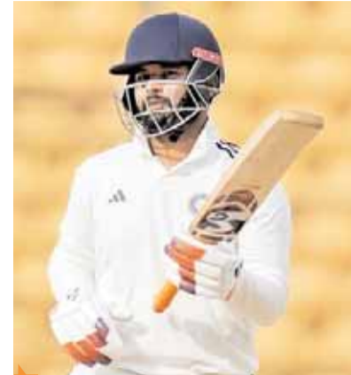
भारत के पूर्व सलामी बल्लेबाज आकाश चोपड़ा ने भी इसी तरह की राय जाहिर की। मुझे लगता है कि ऋषभ पंत आईपीएल के इतिहास में सबसे महंगे खिलाड़ी बनने जा रहे हैं

नई दिल्ली, 20 नवम्बर (एजेंसियां)। भारत के पूर्व बल्लेबाज रॉबिन उथप्पा ने दावा किया है कि आगामी आईपीएल 2025 मेगा नीलामी में विकेटकीपर-बल्लेबाज ऋषभ पंत की बोली 25-28 करोड़ के बीच होगी।