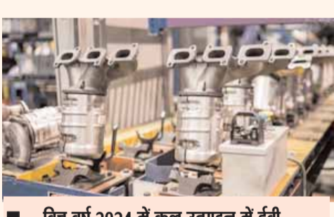
वित्त वर्ष 2024 में कुल उत्पादन में ईवी कंपोनेंट इंडस्ट्री का योगदान हुआ दोगुना

रिपोर्ट में बताया गया है कि स्थानीयकरण और आत्मनिर्भरता पर भारत सरकार के फोकस ने घरेलू विनिर्माण क्षमताओं में महत्वपूर्ण निवेश को बढ़ावा दिया है। वित्त वर्ष 2020 और वित्त वर्ष 2024 के बीच निर्यात में 10 प्रतिशत सीएजीआर देखा गया, जो 21.3 बिलियन