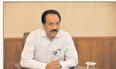
देश अंतरिक्ष उद्योग की सम्पूर्ण मूल्य श्रृंखला का पूरी क्षमता के साथ दोहन करना चाहेगा : एस सोमनाथ

उन्होंने यहां बेंगलुरु टेक समिट 2024 को संबोधित करते हुए कहा कि अंतरिक्ष अर्थव्यवस्था में हिस्सेदारी के लिए भारत का महत्वाकांक्षी लक्ष्य तीन प्रमुख क्षेत्रों- प्रारंभिक चरण (उपग्रह निर्माण और प्रक्षेपण), मध्यम चरण (बुनियादी ढांचा और अनुप्रयोग), और उपभोक्ता बाजार के चरण (डेटा-संचालित