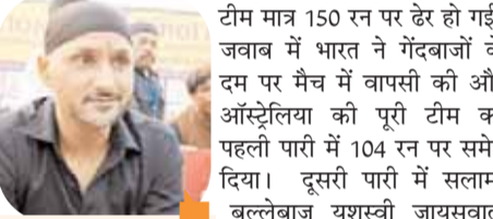
गावत का प्रदर्शन बहुत अच्छा रहा है। ऑस्ट्रेलिया में दबाव बनाना एक कठिन काम है, जो उन्होंने अब तक किया है: हरभजन सिंह

पूरुणिया (बिहार), 23 नवम्बर (एजेंसियां)। बॉर्डर-गावस्कर ट्रॉफी सीरीज के पहले मुकाबले में दूसरे दिन के खेल की समाप्ति पर टीम इंडिया का पलड़ा हावी नजर आ रहा है। मैच का पहला दिन गेंदबाजों के नाम रहा था, लेकिन दूसरे दिन भारतीय सलामी बल्लेबाजों ने शानदार बल्लेबाजी की और मैच पर पूरी तरह से नियंत्रण बना लिया। पूर्व भारतीय ऑफ स्पिनर हरभजन सिंह ने कहा है कि जसप्रीत बुमराह की अनुप्रावित वाली टीम सीरीज का पहला मैच जीतेगी और बॉर्डर-गावस्कर ट्रॉफी 4-1 से जीतकर ऑस्ट्रेलिया में जीत की हैट्रिक पूरी करेगी। भारत ने बॉर्डर-गावस्कर ट्रॉफी में ऑस्ट्रेलिया के खिलाफ पिछली चार टेस्ट श्रृंखलाएं जीती हैं जिसमें दो बार भारत में और दो बार ऑस्ट्रेलिया में उसे जीत मिली है। इस बार जीत के साथ ऑस्ट्रेलिया में सीरीज जीत की हैट्रिक बनेगी। नियमित कप्तान रोहित शर्मा की अनुपस्थिति में कार्यवाहक कप्तान बुमराह ने शुक्रवार को टॉस जीतकर पहले बल्लेबाजी करने का फैसला किया, लेकिन पहली पारी में