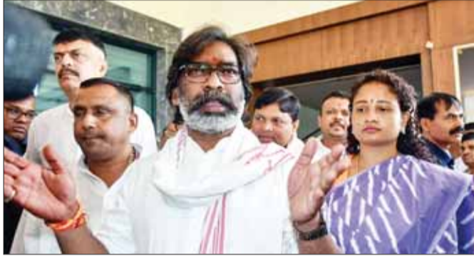
में सभी समुदायों के लोगों और राज्य के सभी किसानों, महिलाओं, युवाओं को बहुमत के साथ वोट देने और इस चुनाव को सफल बनाने के लिए धन्यवाद देता हूँ: हेमंत सोरेन, झामुमो नेता

राज्य में कांग्रेस के नेतृत्व वाले विपक्षी महाविकास अघाड़ी (एमवीए) गठबंधन के उम्मीदवार 37 सीटों पर विजयी हुए हैं और 13 सीटों