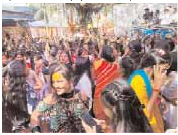
महादेव के जयघोष नारे सुनाई पड़े। इस वर्ष अन्य वर्षों की तुलना में अत्याधिक मेला रहा और धार्मिक वातावरण से