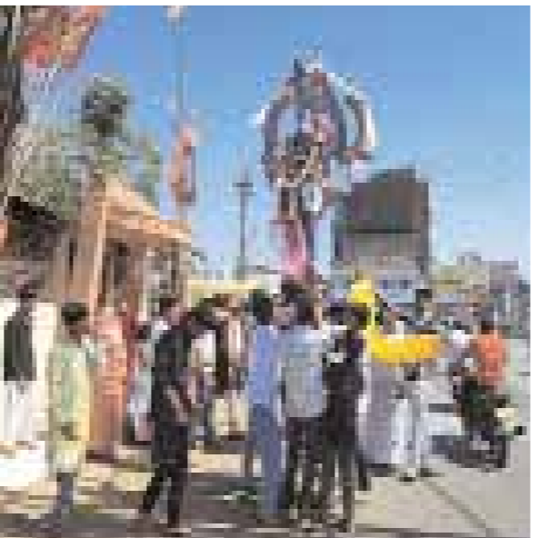
इसी प्रकार महाशिवरात्रि के पावन पर्व पर भक्तप्रिय मोक्षधाम सेवा समिति चंदननगर और नेशनल इंटीग्रेटेड मेडिकल एसोसिएशन छिंदवाड़ा के