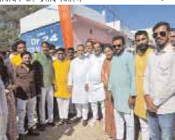
किया गया। देर शाम तक सभी शिव मंदिरों में श्रद्धालुओं का तांता लगा रहा। श्रद्धालुओं के