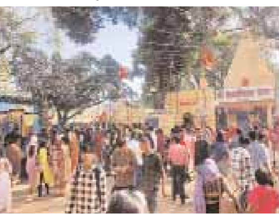
लगाई और पूजन सामग्री बेची जा रही थी और जगह-जगह भण्डारा का आयोजन हुआ।