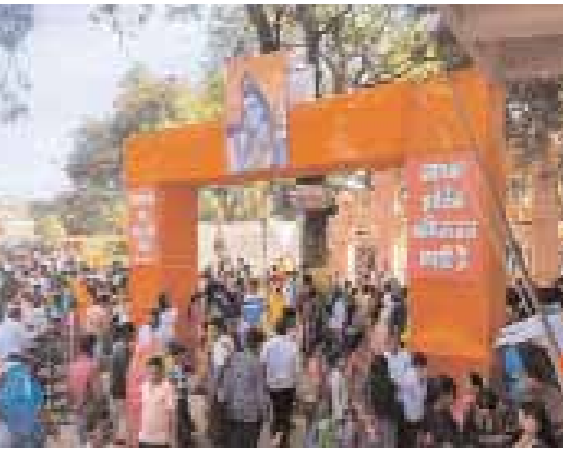
अभिषेक किया गया। इसके बाद महाभारती की गई, इसके बाद श्रद्धालुओं ने पहली पायरी मंदिर में जल भरकर शिवलिंग

महाशिवरात्रि के शुभ अवसर पर बुधवार सुबह से ही शिवालयों में श्रद्धालुओं की भारी भीड़ उमड़ पड़ी। मंदिरों में बोल बम और ऊं नमः शिवायः के जयकारे गूंज उठे। छिंदवाड़ा शहर के मोक्षधाम महाकाल मंदिर और पातालेश्वर मंदिर में हजारों भक्तों ने भोलेनाथ के दर्शन किए। वहीं रामेश्वर धाम में भी जिले भर से हजारों लोग पहुंचे और देवाधिदेव महादेव के दर्शन किए। सुप्रसिद्ध देव स्थलीय विशाला पहली पायरी में स्थित शिव मंदिर में श्रद्धालुओं ने दूध और जल से महादेव का अभिषेक कर पूजा अर्चना की व आशीर्वाद लिया। देर शाम तक शिव मंदिरों में भक्तों की भीड़ लगी रही। जुन्नारदेव विशाला पहली पायरी मंदिर में बुधवार को एक दिवसीय मेला लगा। यहां दूर दराज से श्रद्धालु सुबह से महादेव का दर्शन पाने पहुंचे थे। सुबह 4 बजे शिवजी का जल व दूध से