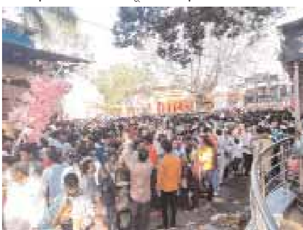
भगत, छोटा भुवन, बड़ा भुवन, जुन्नारदेव विशाला, दमुआ, परासिया, तामिया का छोटा महादेव से लेकर छिंदवाड़ा के श्री पातालेश्वरधाम, मोक्षधाम का महाकाल इन क्षेत्रों में जहां