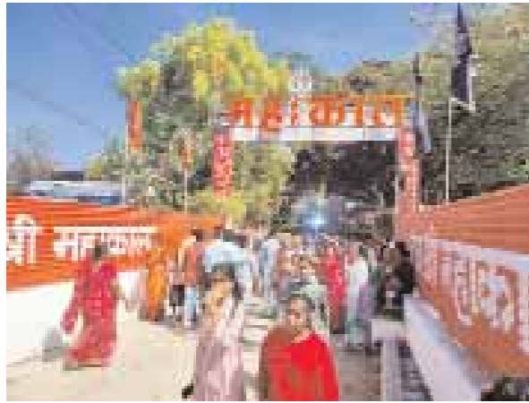
छिंदवाड़ा, देशबन्धु। महाशिवरात्रि पर्व को लेकर जिला और पुलिस प्रशासन जहां पूरी तरह व्यवस्थाएँ की थी तो