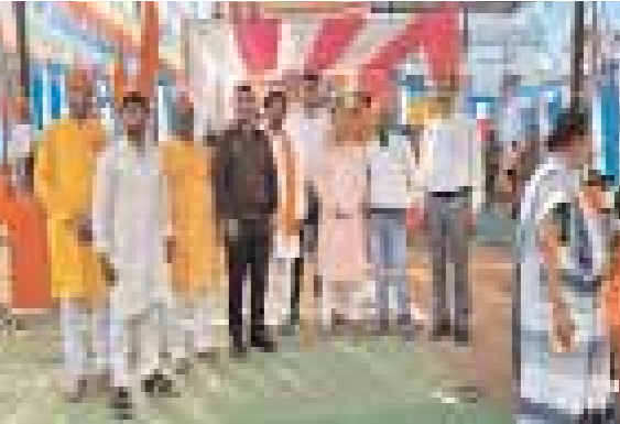
मंदिर परिसर में मौजूद रही। इसके अतिरिक्त अन्य भक्तों द्वारा भी मंदिर परिसर में भंडारा का आयोजन कर प्रसाद वितरण