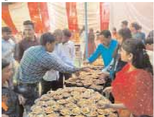
वहीं इस वर्ष व्यवस्था में अतिरिक्त टेंट लगाए गए थे, लायटिंग की शानदार व्यवस्था के साथ महाशिवरात्रि का पर्व अनोखा एवं अद्भुत रहा। चौरागढ़ मंदिर से लेकर भूरा