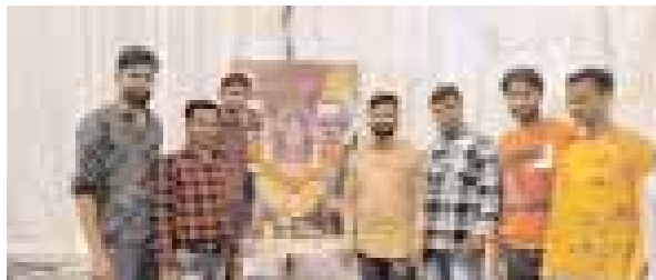
है कि इस दिन भगवान शिव और माता पार्वती की पूजा करने से भक्तों की हर मनोकामना पूरी होती है। लेकिन क्या आप

जानते हैं कि आखिर महाशिवरात्रि पर्व क्यों मनाया जाता है? चलिए आपको इस समाचार के माध्यम से बताते हैं। वैसे तो हर महीने शिवरात्रि मनाई जाती है, जिसे मासिक शिवरात्रि कहा जाता है। लेकिन फाल्गुन माह के कृष्ण पक्ष चतुर्दशी तिथि को शिवरात्रि का विशेष महत्व माना गया है। दरअसल फाल्गुन माह के कृष्ण पक्ष चतुर्दशी तिथि को महाशिवरात्रि के नाम से जानते हैं। महाशिवरात्रि का पर्व शिव भक्तों के लिए बेहद खास महत्व रखता है। इस दिन शिव जी की विशेष पूजा-अर्चना और अभिषेक किया जाता है। शास्त्रों के मुताबिक इस दिन भोलेनाथ की पूजा प्रदोष काल में 4 प्रहर की जाती है। महाशिवरात्रि के दिन देश भर के सभी 12 ज्योतिर्लिंगों समेत शिव मंदिरों में भक्तों की भारी भीड़ उमड़ी रहती है। अब आपको महाशिवरात्रि के बारे में तो पता चल गया, लेकिन क्या आप जानते हैं कि महाशिवरात्रि पर्व क्यों मनाया जाता है? अगर नहीं, तो चलिए आपको विस्तार से बताते हैं कि महाशिवरात्रि मनाने का मुख्य कारण क्या है?