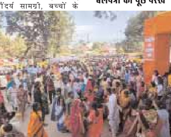
खिलौने, कुल्फी, छाछ के ठेले, आकर्षक झूले सहित अन्य दुकानें लगी रही। शांति व्यवस्था के लिए पुलिस पाकिंग सहित