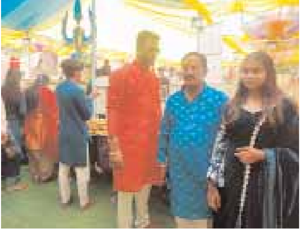
विशाल भण्डारा और मेले का आयोजन किया गया तो वहीं प्रशासन की व्यवस्थाएँ चाक चौबंद रही। चौरागढ़ से लेकर महाकाल पातालेश्वर तक हर हर