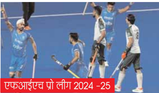
एफआईएच प्रो लीग 2024 -25

■ मेकोंन के साथ हॉकी विश्व कप और एशियाई खेलों से पहले स्टाइकर्स के साथ और सत्र आयोजित करने की उम्मीद