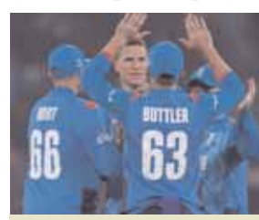
■ इंग्लैंड अब तक दो मैचों में दो हार झेल चुका है यानी एक और हारते हैं तो बिना जीत के सफर होगा समाप्त

कराची, 28 फरवरी (एजेंसियां)। अफगानिस्तान के हाथों 8 रन से मिली हार के बाद सेमीफाइनल की टोंट से बाहर हो चुके इंग्लैंड को अब चैंपियंस ट्रॉफी का एक अनचाहा रिकॉर्ड डरा रहा है। दक्षिण अफ्रीका के खिलाफ शनिवार को इंग्लैंड को नजर होगी जीत के साथ प्रतियोगिता से विदाई लेने की। इंग्लैंड अब तक दो मैचों में दो हार झेल चुका है यानी एक और हारते हैं तो बिना जीत के सफर होगा समाप्त। ऐसा होता है तो इंग्लैंड के इतिहास में ये सिर्फ दूसरी बार होगा जब चैंपियंस ट्रॉफी के किसी एक संस्करण में इंग्लैंड को एक भी जीत नसीब नहीं होगी। इससे पहले 1998 में खेले गए पहली अफ्रीका चैंपियंस ट्रॉफी में ऐसा हुआ था, लेकिन तब टूर्नामेंट का फॉर्मेट नॉक-आउट था और इंग्लैंड एक हार के साथ बाहर हो गए थे। आईसीसी टूर्नामेंट में दोनों के बीच रोमांचक