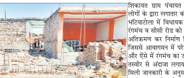
यहाँ तो रंगमंच भी अतिक्रमण से नहीं बच रहे

मण्डला, देशबन्धु। सार्वजनिक उपयोग के स्थानों पर अवैध रूप से कब्जा करने के जिले में अनेकों मामले की शिकायत लगातार की जाती है लेकिन संबंधित विभाग असहाय नजर आ रहा है। शहरी क्षेत्रों में तो पैसे वालों के लिए अनेक मैरिज लॉन एवं विभिन्न आयोजनों के लिए हॉल, हॉटल उपलब्ध हो जाते हैं लेकिन ग्रामीण क्षेत्रों में शादी, विवाह आदि आयोजनों के लिए स्थानों को संरक्षित नहीं किया जा रहा है। ऐसे सार्वजनिक स्थानों को अतिक्रमण से मुक्त कराने की जिम्मेदारी शासन प्रशासन की है इस ओर ध्यान दिया जाना चाहिए। बढ़ती जनसंख्या के चलते कई बार तो एक गाँव में