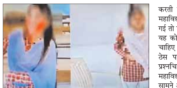
रीवा देशबन्धु। हाल ही में एक वीडियो वायरल हुआ जिसमें एक छात्रा कक्षा में भोजपुरी गाने पर नृत्य