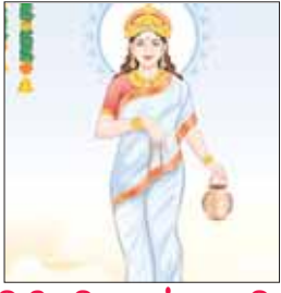
द्वितीय दिवस मां ब्रह्मचारिणी