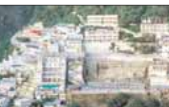
■ गुफा के आसपास तथा कटड़ा कस्बे में सुरक्षाबलों के जवान तैनात

के साथ भी बांटा है और उन्हें आगाह किया है कि वे आतंकीयों पर नजर रखें तथा घटना को टालने के लिए एतिहात बरतें। इतना जरूर है कि उनकी इन सूचनाओं के बाद अन्य खुफिया एजेंसियां चेती हैं या नहीं लेकिन उन लोगों में दृष्टांत अवश्य फेल गई है जो वैष्णो देवी के तीर्थस्थान पर आना चाहते हैं। असल में उनकी दृष्टांत के पीछे का कारण यह भी है कि वे सेना की बातों पर विश्वास करते हैं। वैसे दावा यह भी है कि चैत्र नवरात्र के दौरान माता वैष्णो देवी मंदिर में किसी भी अप्रिय घटना को रोकने के मकसद से एआई से लैस सीसीटीवी कैमरे