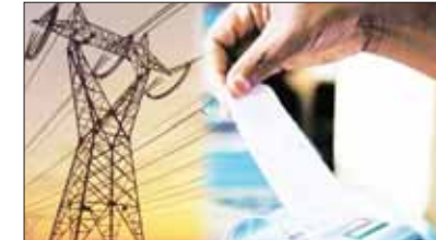
दो। नए दरें एक अप्रैल से लागू होंगी। इसके अलावा, सभी लो प्रेशर और हाई प्रेशर मौसम वाले उपभोक्ताओं के लिए राहत देते हुए न्यूनतम प्रभार को समाप्त कर दिया गया है। नई बिजली दरें अप्रैल से लागू हो जाएंगी, और मई महीने से उपभोक्ताओं को बढ़ी हुई

भोपाल, देशबन्धु। प्रदेश में गर्मी के मौसम में आम जनता को बिजली का बढ़ा झटका लगा है। राज्य विद्युत नियामक आयोग ने वर्ष 2025-26 के लिए बिजली की दरों में 3.46 फीसदी की बढ़ोतरी को मंजूरी दी है। हालांकि, स्मार्ट मीटर वाले उपभोक्ताओं को दिन में बिजली खपत पर 20 फीसदी तक की छूट मिलेगी।