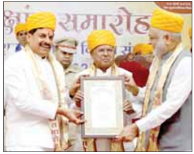
मुख्यमंत्री को दी गई डी-लिट की मानद उपाधि के लिए कठोर अनुशासन की आवश्यकता होती है। मुख्यमंत्री डॉ. यादव ने कहा कि आज उज्जैन का गौरव दिवस भी है। विक्रम विश्व विद्यालय अब सम्राट विक्रमादित्य के नाम से जाना जाएगा।