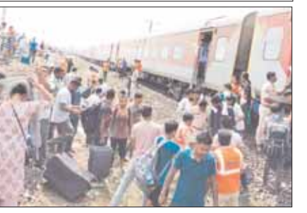
किसी भी प्रकार की जानकारी प्राप्त हो सके। भुवनेश्वर के लिए हेलपलाइन नंबर 8455885999 और कटक के लिए हेलपलाइन नंबर 8991124238 उपलब्ध हैं। हिमाचल में गाड़ियों पर गिरा पेड़, छह की मौत हिमाचल प्रदेश की धार्मिक नगरी मणिकर्ण में नव संवत के दिन एक दर्दनाक हादसा हो गया। कायल का एक पेड़ तेज हवा के चलते नीचे खड़ी गाड़ियों पर गिर गया। पेड़ गिरने से छह लोगों की मौत हो गई। सूचना के बाद पुलिस मौके पर पहुंच गई है। मृतकों में कुछ पर्यटक भी शामिल हैं।