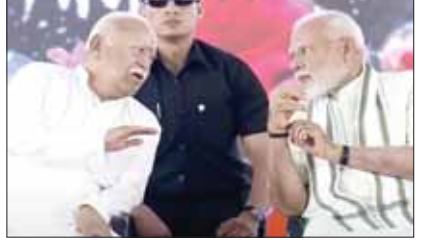
संघ मुख्यालय पहुंचकर हेडगेवार-गोलवलकर को दी श्रद्धांजलि आरएसएस की गौरवशाली यात्रा का 100 वर्ष भी पूरे हो रहे हैं। प्रधानमंत्री नरेंद्र मोदी ने रविवार को नागपुर में राष्ट्रीय स्वयंसेवक संघ के स्मृति मंदिर का दौरा किया। इस दौरान पीएम मोदी ने संघ के संस्थापक डॉ. केशव बलिराम हेडगेवार और द्वितीय सरसंघचालक माधव सदाशिव गोलवलकर को श्रद्धांजलि अर्पित की। पीएम मोदी ने यहां आर्तुकि पुस्तिका पर हस्ताक्षर भी किए।

नई दिल्ली, (एजेंसियां)। प्रधानमंत्री नरेंद्र मोदी ने रविवार को माधव नेत्रालय प्रीमियम सेंटर की आधारशिला रखी। इस दौरान उन्होंने लोगों को संबोधित भी किया। उन्होंने अपने संबोधन में राष्ट्रीय स्वयंसेवक संघ और इसके स्वयंसेवकों को जमकर सराहा। उन्होंने कहा कि राष्ट्रीय स्वयंसेवक संघ भारत की अमर संस्कृति का आधुनिक अक्षय वट है। ये अक्षय वट आज भारतीय संस्कृति को हमारे राष्ट्र की चेतना को निरंतर ऊर्जावान बना रहा है। पीएम मोदी ने यह भी कहा कि जहां भी सेवा कार्य किया जा रहा है, वहां स्वयंसेवक हैं। आज चैत्र शुक्ल प्रतिपदा का ये दिन बहुत विशेष है। आज से नवरात्रि का पवित्र पर्व शुरू हो रहा है। देश के अलग अलग कोनों में आज गुड़ी पड़वा, उगादी और नवरेह त्योहार भी मनाया जा रहा है। आज भगवान झूलाल जी और गुरु अंगद देव जी का अवतरण दिवस भी है। ये हमारे प्रेरणापुंज परम पूज्यनीय डॉ साहब की जयंती का भी अवसर है। इसी साल