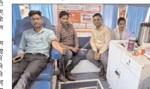
छिंदवाड़ा : शनिवार को रक्तदान करते हुए युवा।